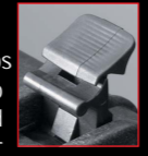
Cierres de doble acción

La maleta Pelican™ para protección de equipos está fabricada en copolímero de polipropileno lo que le confiere una gran dureza y elasticidad interior, a la vez que resistencia exterior. Por tanto ante el impacto de un golpe, la fuerza se "dispersa" exteriormente por lo que no llega a afectar al equipo que contiene. La maleta está reforzada con múltiples nervios que protegen la tapa, llegando hasta las bisagras y cierres. Estos incluyen roscas de acero inoxidable para evitar su corrosión ante condiciones extremas. Estas propiedades son características de Pelican™ al igual que los cierres de doble acción que facilitan su apertura para el usuario a la vez que la mantienen hermética.