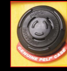
Válvula de despresurización automática