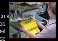
Estampamos tu logo

Pelican ofrece la posibilidad de adaptar un panel electrónico a un total de 12 maletas. Para ello, el fabricante del equipo deberá escoger la maleta que mejor se adapte a su panel electrónico (según sus medidas) utilizando un marco de adaptación (accesorio de Pelican™) para su ajuste. Así puede ofrecer un equipo totalmente protegido por Pelican™. Ello implicará añadir un componente de calidad a su producto, que sus clientes le agradecerán. Otra solución que ofrecemos es la posibilidad de estampar su logo en la maleta con lo cual puede ofrecer un producto totalmente personalizado.