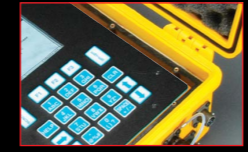
Anillo de sellado