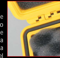
Anillo de sellado

A través de su anillo de sellado de neopreno, que une la tapa con el resto de la maleta, se consigue un cierre totalmente hermético. Además, la válvula de despresurización automática de la presión libera el aire acumulado en el interior (originado en vuelos o diferencias de presión atmosférica) a la vez que la mantiene impermeable a las moléculas de agua. Así se consigue una maleta totalmente estanca al agua, polvo y corrosión.